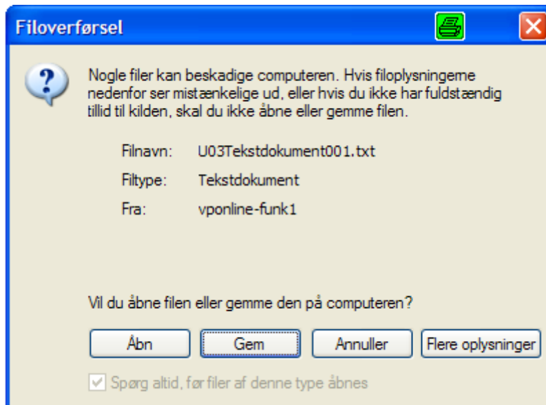
Figur 3. Hent post vindue.

Ved klik på post og på operationen Hent får man vist et filoverførsels vindue. Filoverførsels vinduets udformning vil variere alt afhængig af ens operativ system version. Nedenfor er angivet hvorledes filoverførsels vinduet ser ud ved brug af Windows XP SP1, IE 6 SP2: